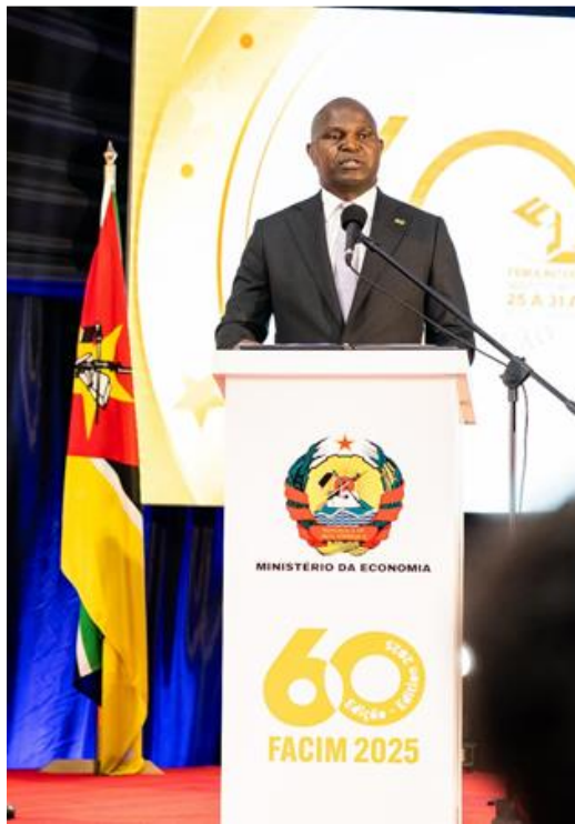
Fig 2: Sua Excelência, Presidente da República, discursando na Cerimónia de Abertura

No discurso de abertura, Sua Excelência o Presidente da República de Moçambique felicitou os presentes com destaque para os expositores nacionais e estrangeiros, e salientou o seguinte: