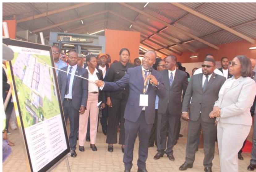
Fig.3: Sua Excelência Primeira-Ministra recebendo explicação sobre o Layout geral da FACIM 2025

At the end, he commended in particular the winners ( Anexo II ) who, from now on, will have the responsibility of being Ambassadors of the FACIM until its 61 st Edition which will take place in 2026, wishing everyone a good return to their places of origin, whether in Mozambique or abroad.