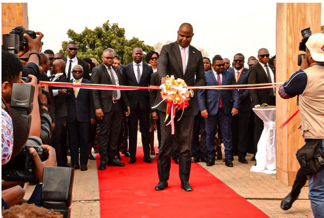
Figura 1: Sua Excelência Daniel Francisco Chapo, Presidente da República na inauguração da 60ª Edição da FACIM 2025

A cerimónia de abertura oficial da 60ª Edição realizou-se no dia 25 de Agosto de 2025 e foi presidida por Sua Excelência Daniel Francisco Chapo , Presidente da República, acompanhado por Membros do Governo, Secretários de Estado de Nível Central e Provincial Governadores de Província, Representantes de instituições públicas e sector privado; Corpo Diplomático acreditado em Moçambique, e outras individualidades nacionais e estrangeiras.