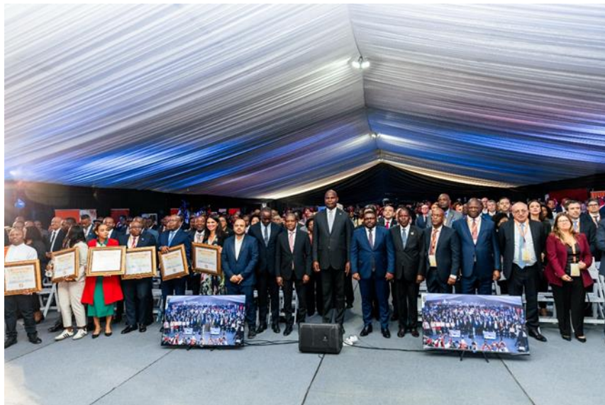
Fig 4: Sua Excelência Presidente da República, com os premiados no Dia do Exportador