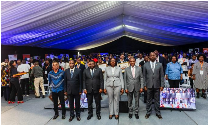
Fig 5: Sua Excelência Primeira Ministra, com os premiados do Dia de Moçambique